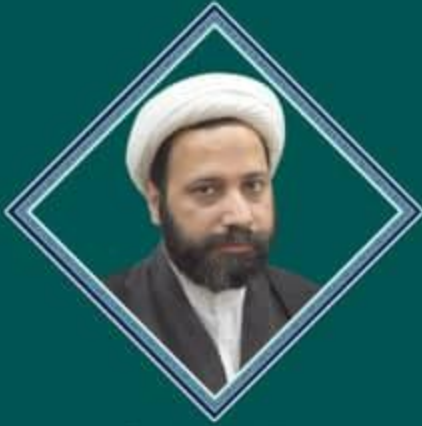
حجت الاسلام و المسلمین استاد قادری