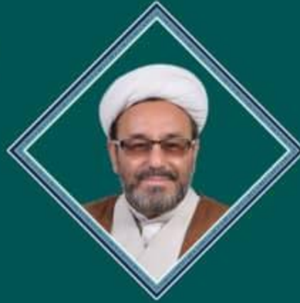
حجت الاسلام و المسلمین استاد رستمی