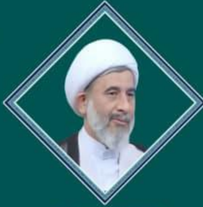
حجت الاسلام و المسلمین استاد نفاذت