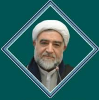
حجت الاسلام و المسلمین استاد حقی بناد