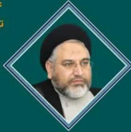
حجت الاسلام و المسلمین استاد مروان حسینی