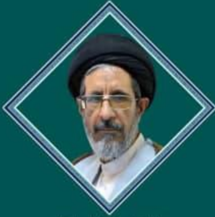
حجت الاسلام و المسلمین استاد سجادی زاده

تفسیر و علوم قرآن علوم و معارف حدیث تفسیر تربیتی